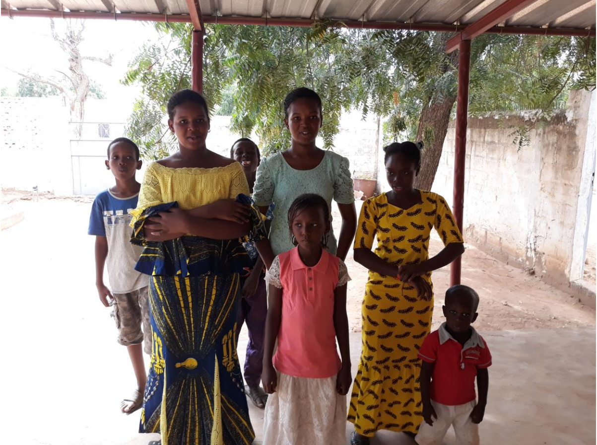
Lingeerin seurakunnan nuorisoa jumalanpalveluksen jälkeen.

Mbodoni nela e mon Eliyaasa, annabi o, hade garal ñalawma JOOMIRAADO, oon ñalawma mawdo, kulbiniido.