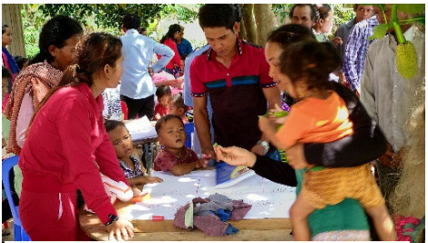
Vierailu avioliittoseminaarissa Kam- bodžan maaseudulla