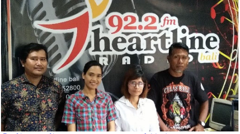
Balin radioaseman työntekijöitä tapaamassa