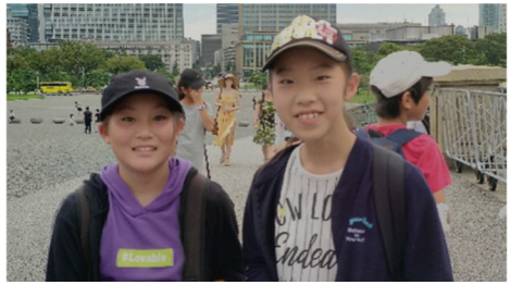
Japanissa kristittyjä on alle 1%