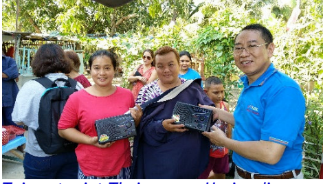
Toivon tuojat Thaimaassa. Uusi radio