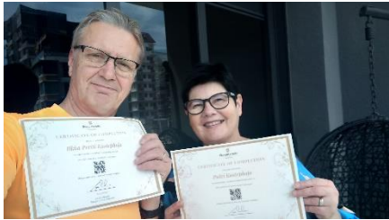
Karanteeniviikoista saimme todistuksen. Koronatesti oli meillä 100% negatiivinen.