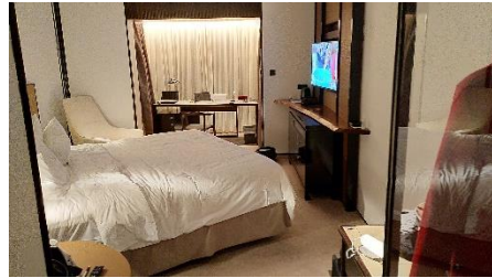
Kaksi viikkoa karanteenieristyksessä oli aktiivista työaikaa ja valtion taholta palvelu pelasi.