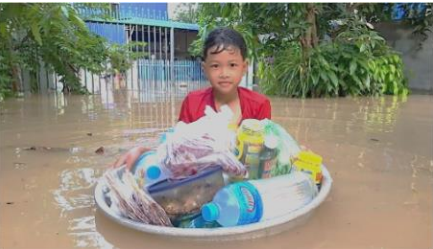
Kambodzassa on tulvinut viimeviikot. Myös Krusa-FM radiaseaman johtajan koti sijaitsee tulva-alueella.